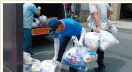
暑い中、ごみ収集を体験しました