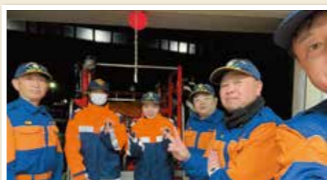
白山消防団年末警戒にて