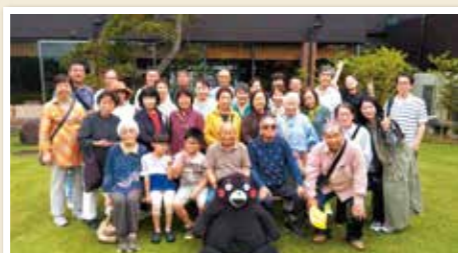
和気あいの白山校区二町内親睦旅行