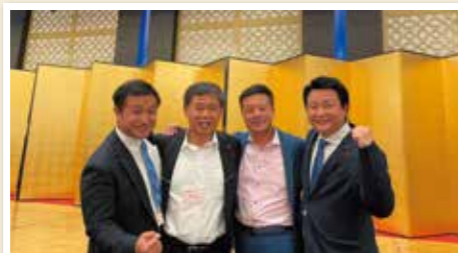
飲食業組合全国大会in熊本にて