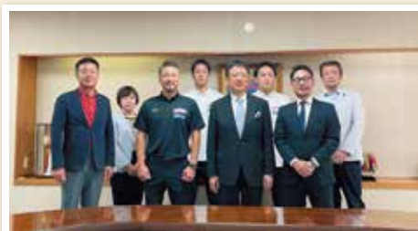
熊本ヴォルターズ支援議連の代表として