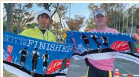
視察を兼ねて神戸フルマラソン大会完走