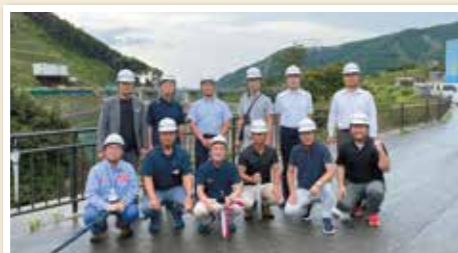
立野ダム視察は有意義でした