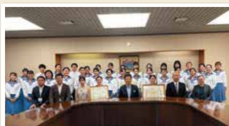
出水中合唱部、全国大会出場で市長へ表敬訪問