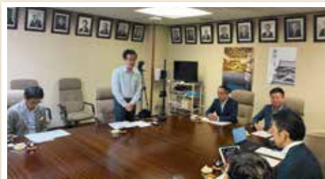
千葉市議会より本市視察の対応